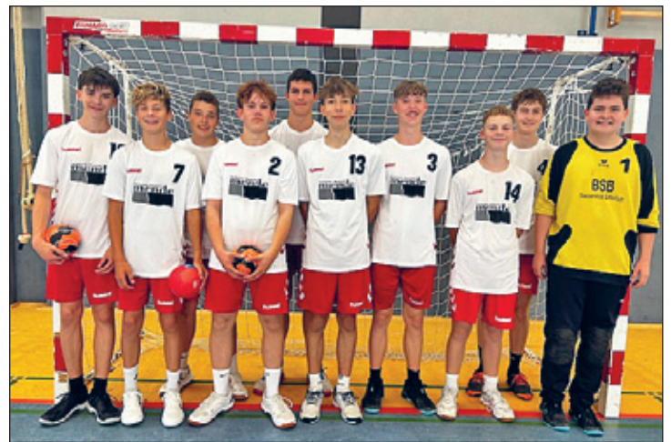
Die aktuelle B-Jugend der SG- Weixdorf, Abteilung Handball mit den drei Radeberger Gastspielern

Die neue Punktspiel-Saison bei den Handballern der SG Weixdorf ist gestartet