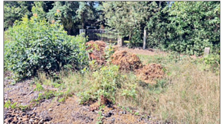
Ablagerungen von Grünschnitt auf den Flächen der DB

Aus gegebenen Anlass möchte die Verwaltungsstelle darauf hinweisen, dass privater Grünschnitt nicht auf den Flächen der Deutschen Bahn entsorgt werden dürfen.