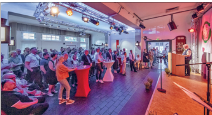
Begrüßung der Gäste durch den Ortsvorsteher

Am 15. Mai 2024 fand der Frühjahresempfang des Ortschaftsrates wieder im Dixiebahnhof statt. Hier ein paar Bilder des Fotoclub Reflex e.V. Der Ortsvorsteher begrüßte u. a. den Landtagsabgeordneten Christian Hartmann und den Leiter des Polizeireviers, Herrn Polizeirat Kunath.