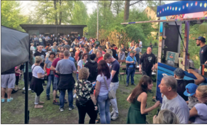
Der Maibaum wurde gerade aufgestellt