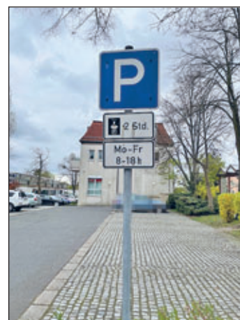
„Weixdorfer Rathausplatz“ bei der Sparkasse

Auf den folgenden Parkflächen ist das Parken gemäß § 13 Absatz 2 StVO nur mit der vorgeschriebenen Parkscheibe möglich: