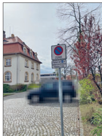
„Weixdorfer Rathausplatz“ beim Rathaus

Bei den Kontrollen wird ein besonderes Augenmerk auf den ruhenden Verkehr gelegt.