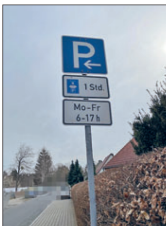
„Zum Bahnhof“ vor der Kita Heidelberg und dem Hort der Grundschule

Laut der StVO ist zum Parken die rechte Seite der Fahrbahn zu benutzen. Auch das Parken an engen oder unübersichtlichen Straßenstellen ist unzulässig (vgl. § 12 Abs. 1 StVO). „Eng“ ist eine Straßenstelle, wenn der neben dem haltenden / parkenden Fahrzeug zur Durchfahrt freibleibende Raum weniger als 3,05 m beträgt und dadurch ein Vorbeifahren gefährlich oder nur unter ungewöhnlichen Schwierigkeiten möglich ist.