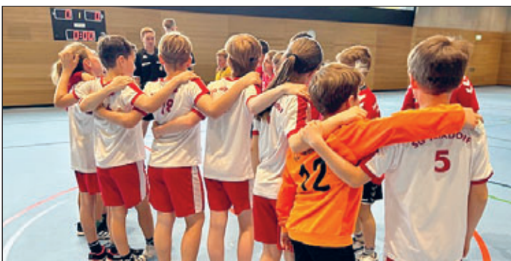
Geschlossenes Auftreten der E-Jugend vorm Spiel gegen die SG Klotzsche.

Sylvia Krause (Jugendwart Abteilung Handball, SG Weixdorf)