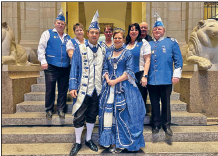
Delegation des WKC