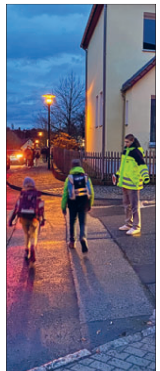
Schülerlotse in Aktion