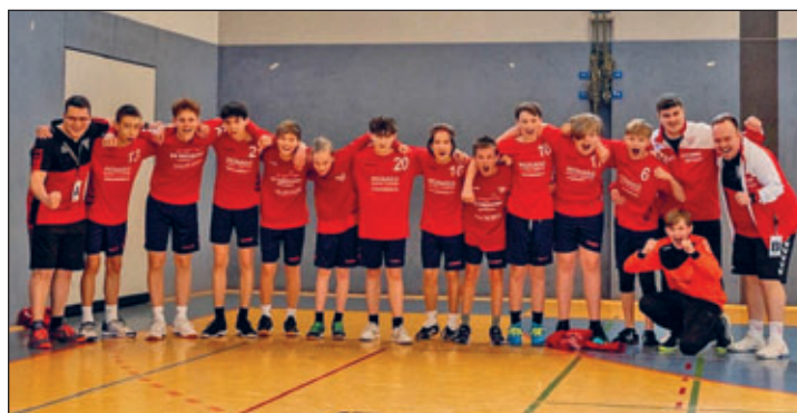
Die Handball-C-Jugend der SG Weixdorf