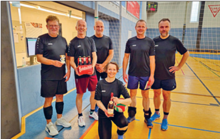
Platz 3 – Die Nimmermüden