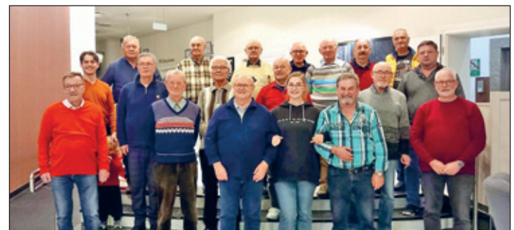
Nach erfolgreicher Probenarbeit im Chorsemnar

Am letzten Wochenende des Novembers gab es ein noch bedeutsames „Zum ersten Mal“ in unserer Vereinsgeschichte der nach-Wende-Zeit. Zur Vorbereitung unserer Adventskonzertsaison und zur Weiterentwicklung unserer Zusammenarbeit mit Liubawa führen wir Sänger zusammen mit unseren Frauen in das nahe gelegene Bad Flinsberg/Polen. Dort angekommen gaben wir am Freitagabend ein Konzert für die Gäste unseres Hotels.