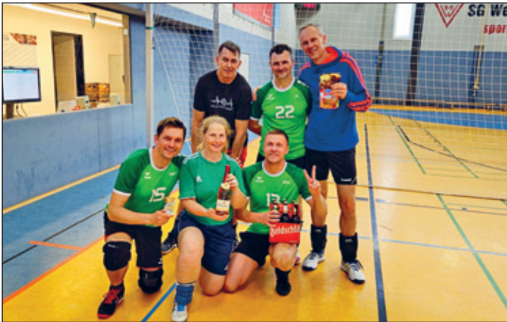
Platz 2 – Freizeitblocker