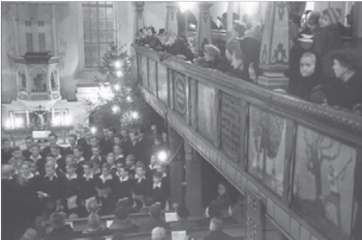
Der Kreuzchor in der schön geschmückten Pastor-Roller-Kirche am 13. Dezember 1945 unter der Leitung des Kreuzkantors Rudolf Mauersberger.

Der furchtbare II. Weltkrieg war „Gott sei Dank“ vorbei. Im Bombenhagel der Luftangriffe auf Dresden zum Ende dieses Krieges wurde nicht nur hauptsächlich die Innenstadt Dresden zerstört, sondern auch die Wirkungsstätten des Dresdner Kreuzchores, die Kreuzschule mit ihrem Internat und auch die Kreuzkirche. Trotz aller Zerstörung, der Trauer um die Toten, dem vorherrschenden Mangel an Allem und dem Hunger, man ließ sich nicht entmutigen – auch die Verantwortlichen für den Kreuzchor nicht: Schon am 27. Juni 1945 fand die erste Probe des neu zusammengesetzten Chores unter der Leitung des Kreuzkantors Rudolf Mauersberger statt. Erst nach wochenlangem Üben konnte wieder an virtuose Vervollkommnung des Chores gedacht werden. Die „künstlerische“ Aufgabe bestand im Wesentlichen aus Kirchendienstmusiken, im Singen vor Flüchtlingen und buchstäblich im „Ersingen“ von Lebensmitteln für das Alumnat, um den Hunger einigermaßen zu bändigen. Dazu gastierten die Kruzianer reihum in den unzerstörten Kirchen der Stadt Dresden und des Umlandes. Sie sangen aber auch in Dorfgaststätten und Schulen aufzutreten.