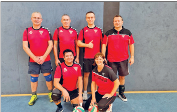
Team Weixvolleys I