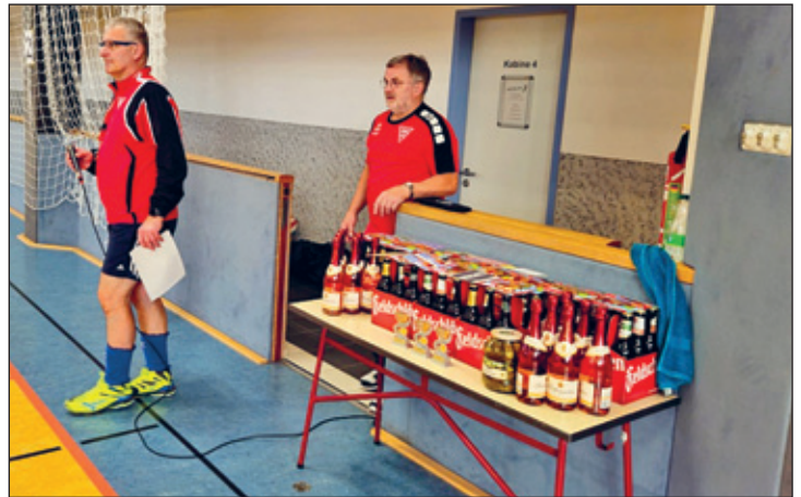
Vor der Siegerehrung – die Präsente