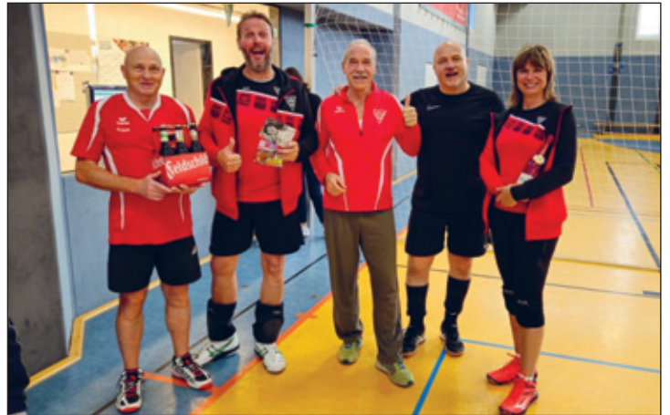
Weixvolleys II nach dem Tag