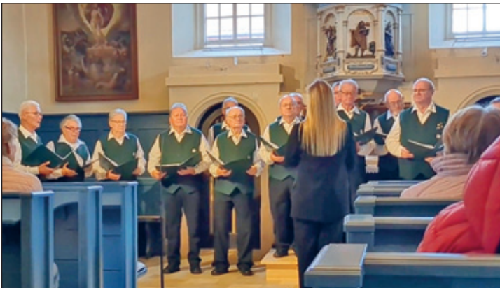
Herbstkonzert 2024 in der Pastor-Roller-Kirche

Wie in jedem Jahr (mit Ausnahme der schon fast vergessenen zwei Jahre 2020/21) führen wir unsere Tradition der Adventskonzerte in unserer Weixdorfer Pastor-Roller-Kirche auch 2024 weiter. Der Monat November war für unseren Männergesangverein gekennzeichnet von zwei wichtigen Premieren in der Weiterentwicklung unseres Chors.