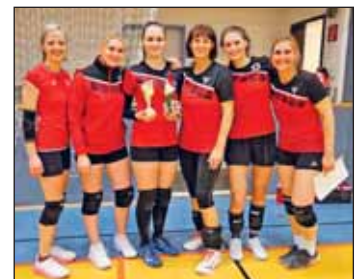
Sieger – Eili-Girlies