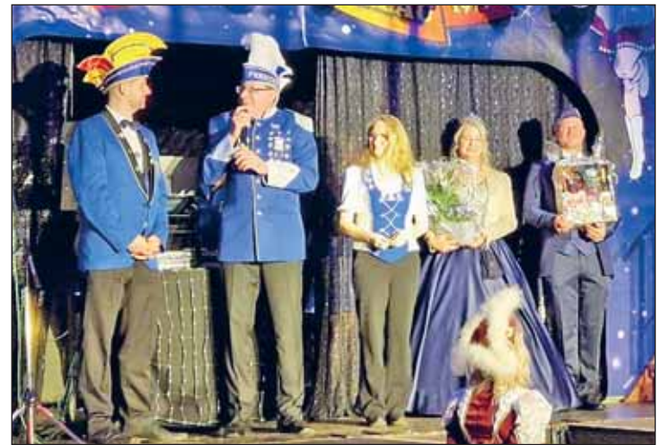
der WKC beim OCC

Da Karnevalisten gerne feiern (ja wer hätte das denn gedacht), wird jede freie Gelegenheit genutzt, auch andere Vereine zu besuchen. Nachdem letztes Jahr im November viele befreundete Vereine bei unserem Jubiläum zu Gast waren, können wir dieses Jahr befreundeten Vereinen zu ihren Jubi's gratulieren. Angefangen am 25. Januar 2025 bei unserem direkten Nachbarn, 50 Jahre Ottendorfer Carnevals Club e.V. folgten am 01. Februar 2025 die Jubiläumsveranstaltung 675 Jahre Weinböbla & 55+1 Jahre WKV. Und es werden diese Saison noch einige folgen.