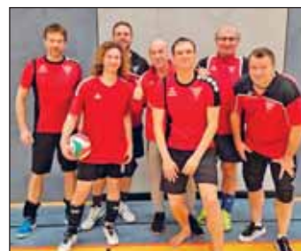
Team Weixvolleys I