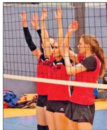
Bereit für den Aufschlag