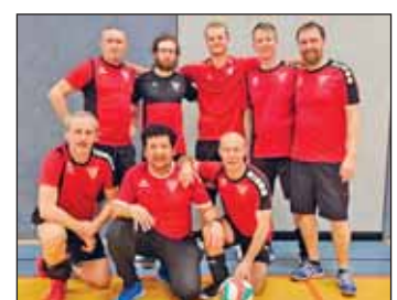
Team Weixvolleys II