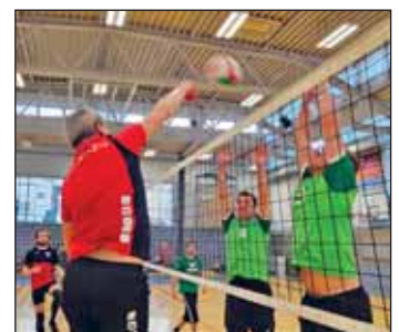
Schusti im Angriff