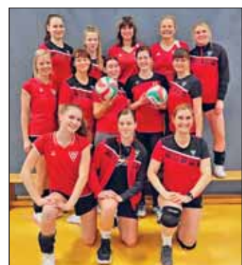
Damen der Weixvolleys