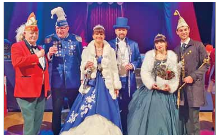
der WKC beim WKV