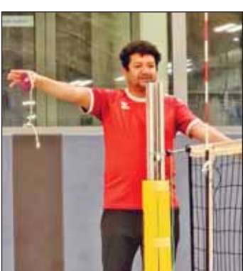
Oscar unser Multiplayer