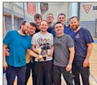
Sieger – die Ottis