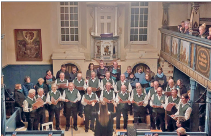
Adventssingen in der Pastor-Roller-Kirche