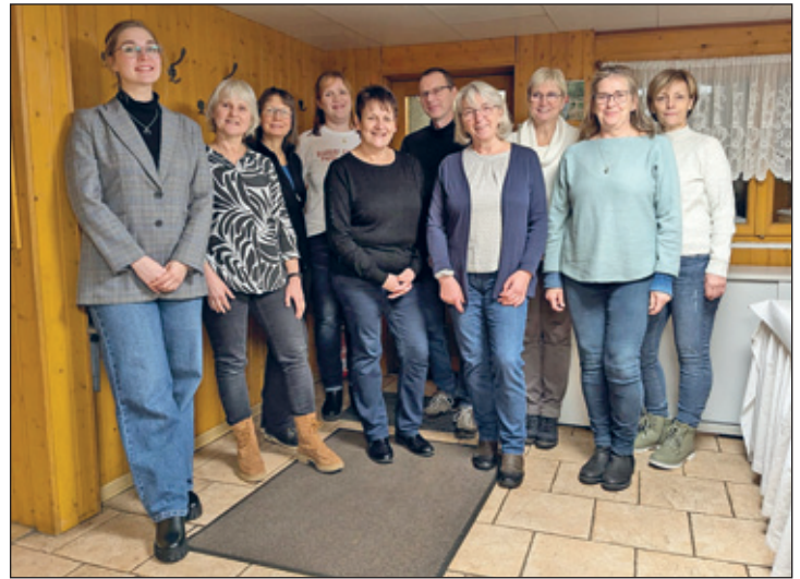
Die Weixdorfer Teichperlen