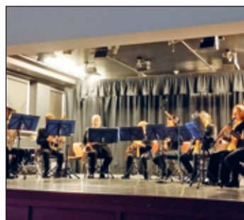
Musikverein 71. e.V.

vorgenommen. Die Bedienung der Gäste ging den Schülern/innen flott von der Hand, sodass es niemanden an Speisen und Getränken fehlte.