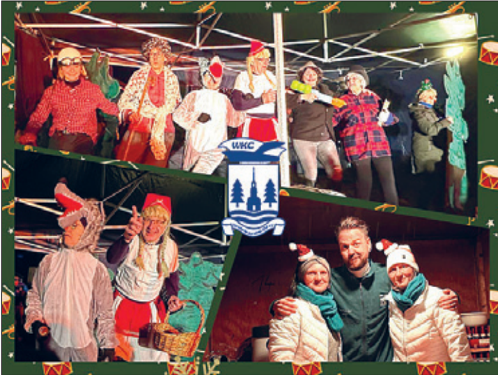
(Veranstaltung Adventsfenster Türchen Nummer 7)

Wir starteten unser kleines Programm mit dem Wichtel-Tanz unserer Showtanzgruppe und führten anschließend das Märchen „Rotkäppchen“ auf - natürlich etwas anders als es im Märchenbuch der Gebrüder Grimm steht. Das Angebot an Glühwein, Kinderpunsch, Wiener Würstchen und Bockwurst wurde reichlich angenommen und so konnten wir den Abend überdacht, mit Heizstrahlern, bei Musik und guten Gesprächen ausklingen lassen.