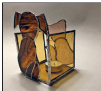
Teelicht Hund und Katze