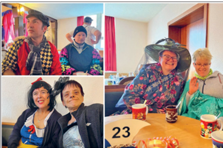
(Wohngruppe aus Weixdorf)

Jeden Sonntag machen wir Ausflüge und besuchen immer öfter Veranstaltungen im Ort. Besonders freuen wir uns auf die neuen Veranstaltungen des WKC, die im Februar stattfinden. Wir sind gespannt und genießen es, Teil des bunten Dorflebens zu sein!“