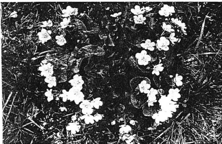
DIE SUMPFDOTTERBLUME wächst im Frühjahr in Sumpfviesen, an Gräben und Bächen. Früher war sie an zahlreichen Orten zu finden. Heute kommt sie durch Entwässerungen nur noch selten vor.

gez. Dr. Herbert Wagner Oberbürgermeister