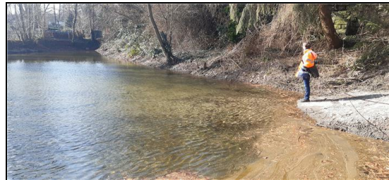
Abb. 4: Kontrolle entlandeter Gebergründteich, 21.03.2022