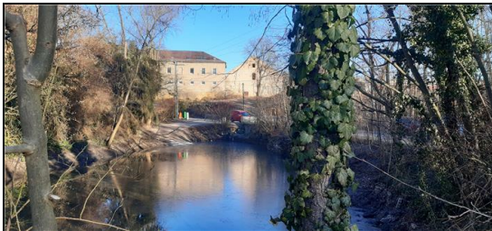
Abb. 3: Entlandeter Gebergründteich, Abnahme, 09.03.2022