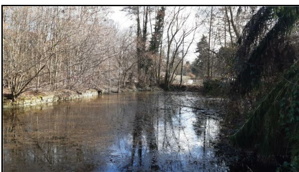
Abb. 1: Vor der Maßnahme: Teich mit mächtiger organischer Sedimentauflage, 01.03.2021