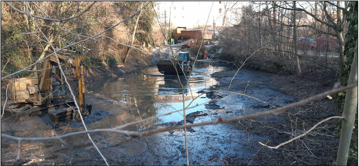
Abb. 2: Entlandung Gebergründteich, 01.03.2022