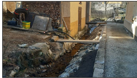
Abb. 4: Schönfelder Bach, aufgeweitetes und naturnah gesichertes Gerinne, 23.03.2022