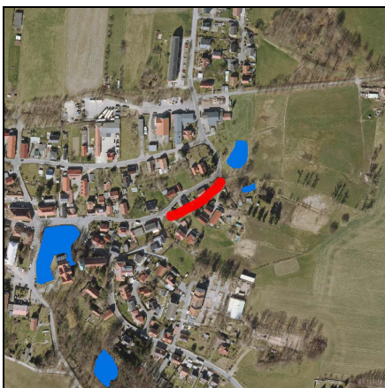
Lageplan Maßnahme, Gewässerabschnittsrenaturierung auf einer Breite von 5m, GH_I-86-00520 Maßstab 1:10.000