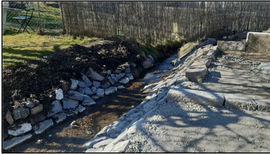
Abb. 3: Schönfelder Bach, aufgeweitetes und naturnah gesichertes Gerinne, 23.03.2022