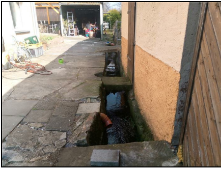
Abb. 2: Schönfelder Bach vor der Maßnahme, 10.06.2020