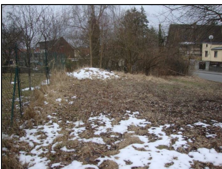
Abb. 1: vor Maßnahmeumsetzung: verrohrter Gewässerbereich, 05.03.2020