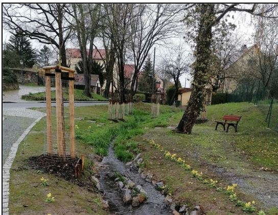
Abb. 4: nach Fertigstellung: offen gelegter Bachabschnitt mit naturnaher Ufersicherung, 17.04.2023