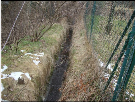
Abb. 2: vor Maßnahmeumsetzung: Sohlbefestigung mit Betonhalbschale, 05.03.2020