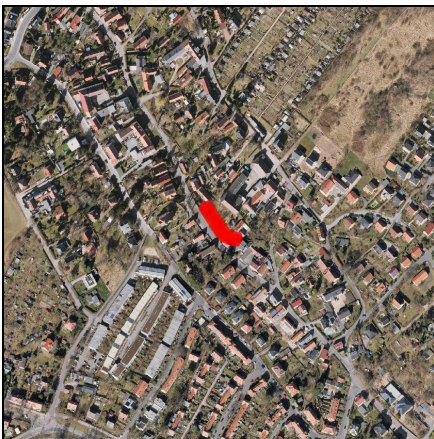
Lageplan Maßnahme, Gewässerabschnittsrenaturierung auf einer Breite von 10m, GH_I-86-00033.02 Maßstab 1:10.000