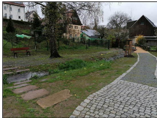
Abb. 5: nach Fertigstellung: Klotzcher Dorfbach und gewässerbegleitende Freifläche, 17.04.2023