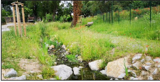
Abb. 6: Renaturierter Abschnitt des Klotzscher Dorfbaches, 20.06.2023