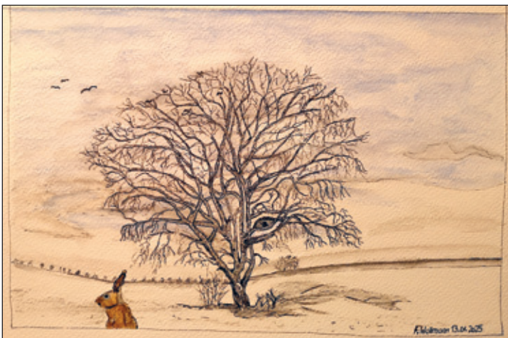
Soltär II / Frank Wollmann

Je stürmischer es um Lichtmess ist, desto sicherer ein gutes Frühjahr ist. Es wird gewöhnlich sehr lang kalt, wenn der Nebel zu Lichtmess fällt.