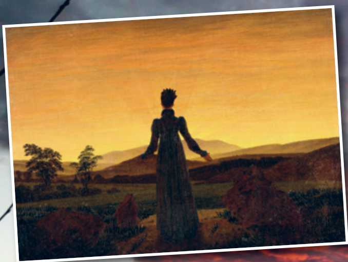
Foto klein: Caspar David Friedrich „Frau vor untergehender Sonne“ (1818) Foto groß: Irina Simon (2025)

Leuchtende Sonnenuntergänge faszinieren! — vor 200 Jahren und heute