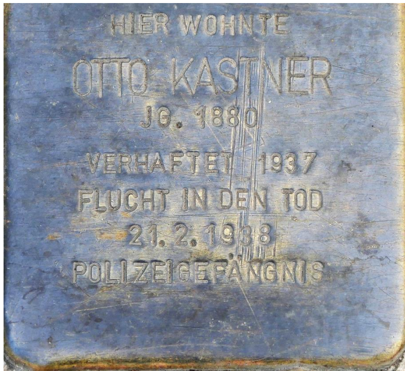
Dresden, Marschnerstr. 21 Verlegt am 28.9.2015