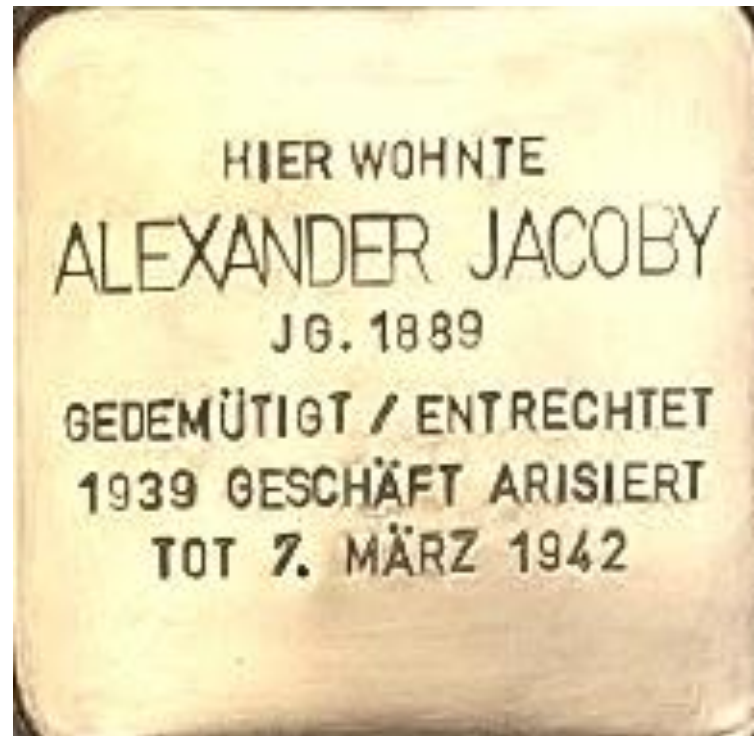
Goetheallee, Ecke Lothringer Weg 14b Verlegt am 23.9.2022

© Ev.-luth. Kirchgemeinde Dresden-Blasewitz