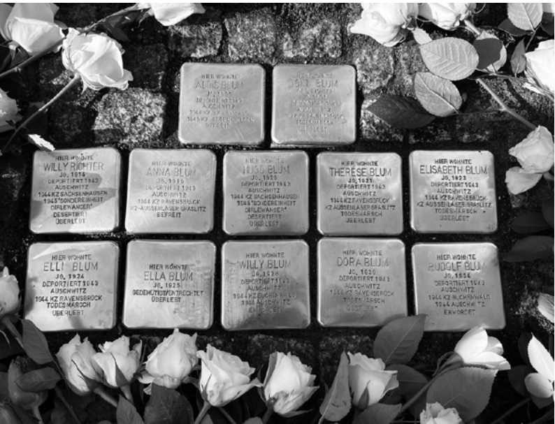
↑ S. 28: Stolpersteine der Familie Blum