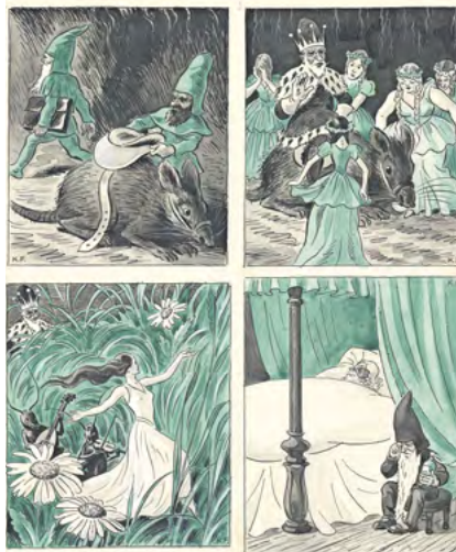
Illustrationen zum Märchen „Der Rabenonkel“ von Kurt Fiedler.

Die Nachricht erreichte auch das Zwergenfräulein, das mit ihrem Onkel hoch oben in einer steilen Felswand lebte. Sie nannte ihn „Rabenonkel“, weil er einst einen Raben zähmte und auf diesem umherfliegen konnte. Mit Hilfe des Rabenonkels gelang es dem Zwergenfräulein