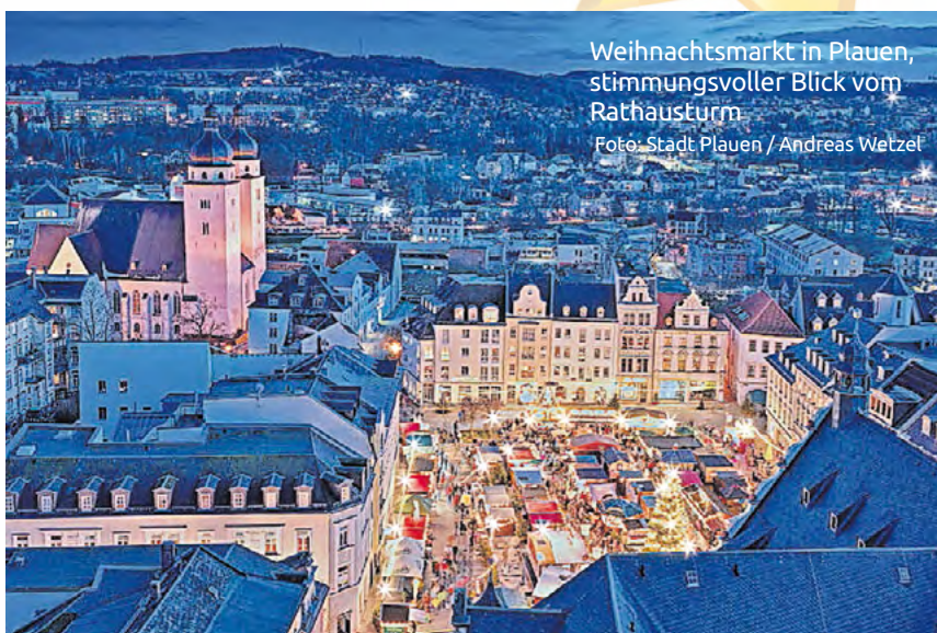
Weihnachtsmarkt in Plauen, stimmungsvoller Blick vom Rathausurm