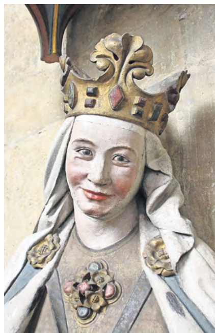
Dom zu Meissen - Kaiserin Adelheid

Unter dem Motto „Der Kaiserin zum Advent“ findet am 14./15.12. ein buntes Adelheid-Fest im Kreuzgang des Meißner Wahrzeichens statt. Das meisterhafte Bildnis der Domstifterin und Heiligen Adelheid von Burgund aus den Händen des Naumberger Meisters ist seit mehr als 750 Jahren im Dom zu bewundern und von internationaler Bekanntheit.