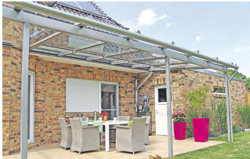
Das Pultdach ist eine einfache und beliebte Lösung für die Überdachung einer Terrasse.

Die „klassische“ Terrassenüberdachung ist das einfache Pultdach, das an der Hauswand befestigt ist und vorn in der Regel von zwei Stützen gehalten wird. Ist es zusätzlich mit einer Beschattung wie einer Markise versehen, erfüllt es bereits die Grundanforderungen an einen wirkungsvollen Regen- und Sonnenschutz. Wer mehr Komfort möchte, kann das Terrassendach weiter aufwerten. Dies kann mit einer Festverglasung beginnen, die an der „Wetterseite“ montiert wird und gegen seitlich einfallenden Regen und Wind schützt. Man kann die Überdachung aber auch vollständig