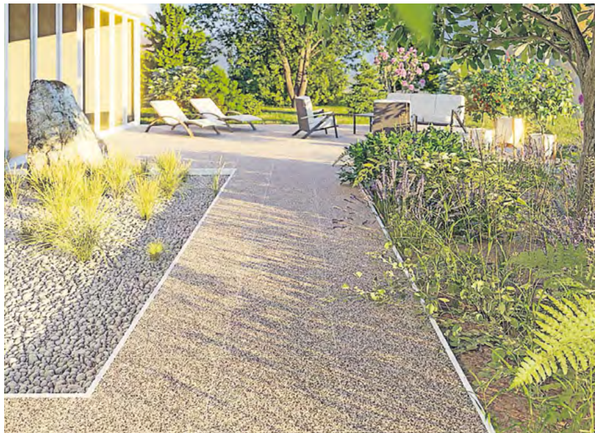
Mit einer Vielzahl an Farben bringt Naturstein Individualität in den Garten.

Sanierungstau hin oder her. Auf die Terrasse möchte wohl niemand tage- oder wochenlang