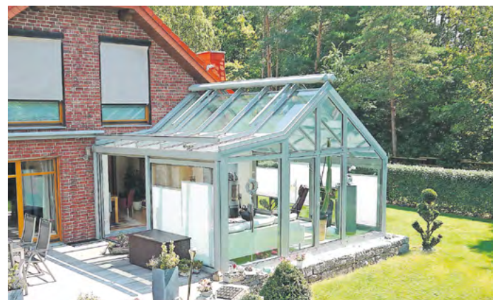
Ein Wintergarten in Wohnraumqualität erfordert sorgfältige Planung und muss auf die Nutzungswünsche der Bauherrenfamilie abgestimmt sein.