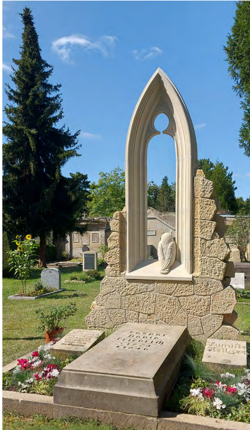
Auf dem Trinitatisfriedhof: an der Grabstelle von Caspar David Friedrich.

Die Veranstaltung auf dem Neuen Annenfriedhof ist der Abschluss des Modellprojekts „Vom Parkfriedhof zum Friedhofspark“ im Forschungsvorhaben „Green Urban Labs II“. Der Verband der Annenfriedhöfe Dresden und das Amt für Stadtgrün und Abfallwirtschaft stellen gemeinsam die Ergebnisse von drei Jahren Forschung, Planung und Bürgerdialog zur Fläche „Friede und Hoffnung“ vor. Präsentiert werden auch die Entwürfe für die Grünfläche und das Gebäude.