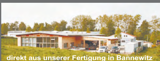
direkt aus unserer Fertigung in Bannewitz

Bungalow - Wohnhäuser www.bungalow-wohnhaus.de